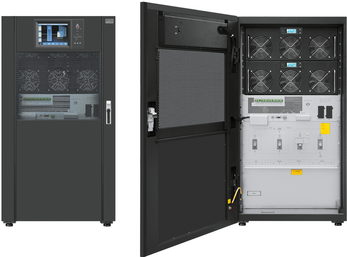
Силовой шкаф HEM100-50X (100 кВА макс. 2 слота для силовых модулей HEPM50X )