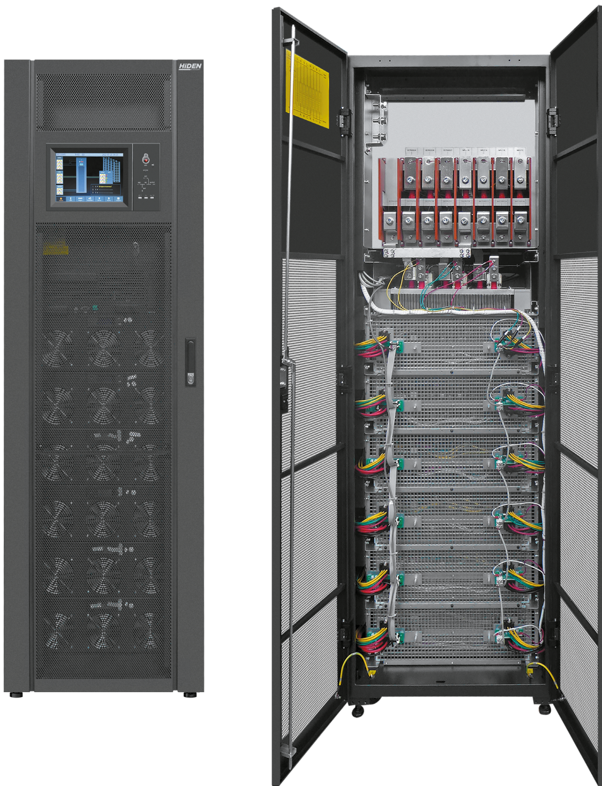
Силовой шкаф NEM300-50X (300 кВА макс. 6 слотов для силовых модулей HEPM50X )