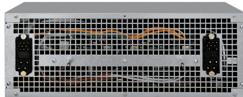
Силовой модуль NEPM50X (50 кВА PF=1)