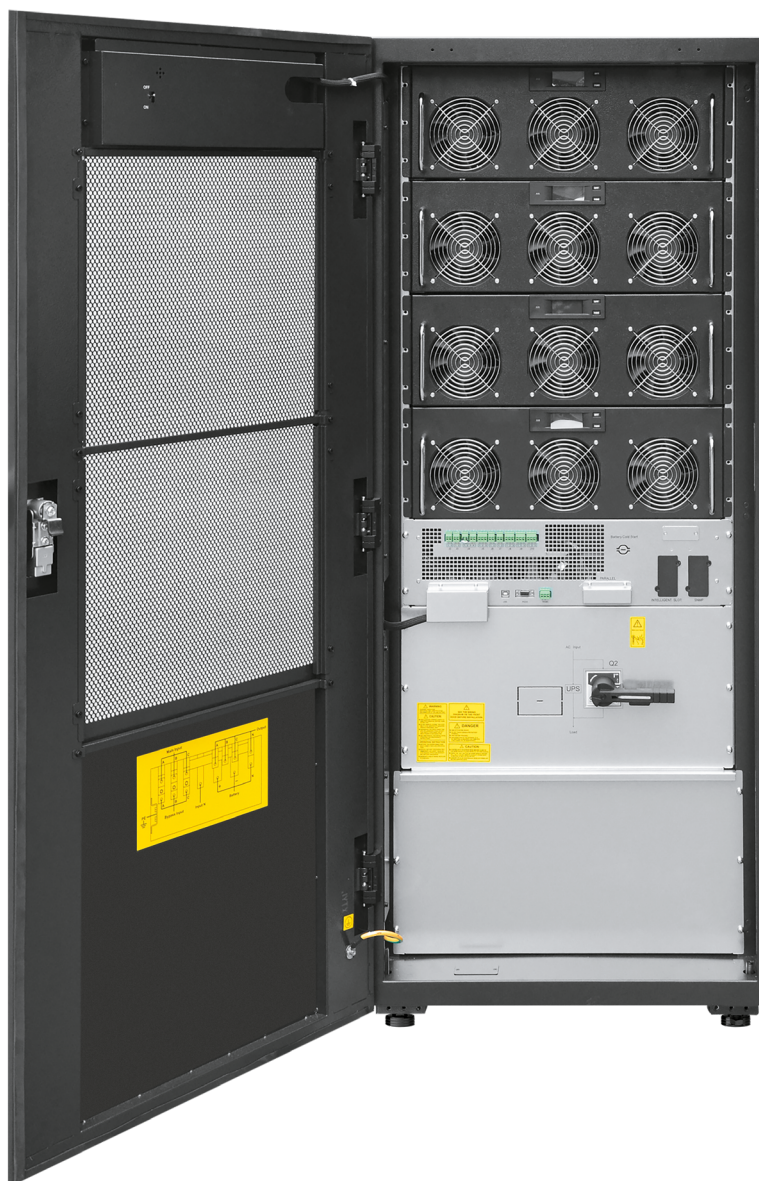
Силовой шкаф HEM200-50X (200 кВА макс. 4 слота для силовых модулей HEPM50X )